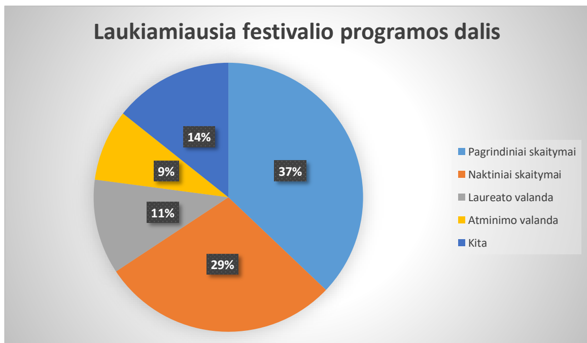
3 diagrama „Kuri festivalio „Imbiero vakarai“ programos dalis yra Jūsų laukiamiausia (mėgstamiausia)?

Daugiausia respondentų atsakė, kad labiausiai mėgsta „Pagrindinius skaitymus“, kurie trunka dvi dienas. „Naktinių skaitymų“ laukia šiek tiek mažiau apklaustųjų. Remiantis atsakymais „Laureato valanda“ ir „Atminimo valanda“ yra ne tokios populiarios respondentų tarpe. Į pasirinkimus įtraukėme ir variantą „Kita“, kadangi „Imbiero vakarų“ programą sudaro ir daugiau dalių, tačiau visi iki vieno šiame atsakymų lauke nurodė, kad nežino . Taip, ko gero, atsitiko todėl, kad ankstesniame klausime buvo keli respondentai, kurie teigė, jog apie šiuos trumposios prozos skaitymus nėra net girdėję (todėl ir neturėjo atsakymo į šį klausimą).