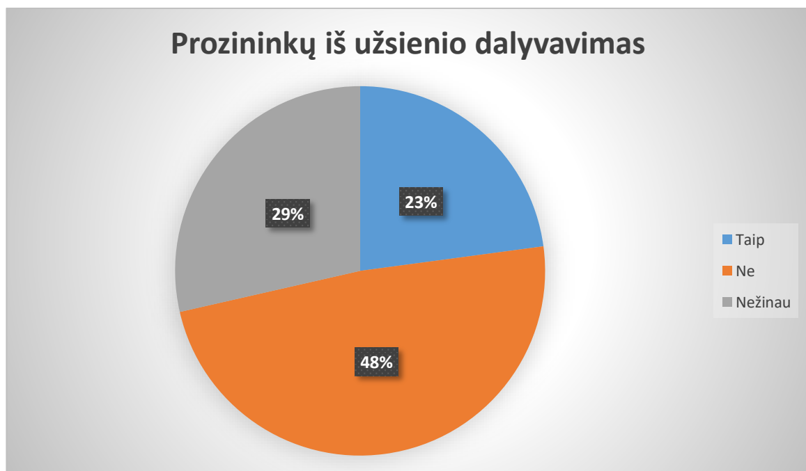
4 diagrama „Ar Jums svarbu, kad festivalyje dalyvautų rašytojai iš užsienio?“

Beveik pusei į apklausos klausimus atsakusių žmonių rašytojų iš užsienio dalyvavimas nėra būtinas. 23 % respondentų minėtas dalykas yra aktualus, o net 29 % neturi nuomonės šiuo klausimu. Pagal atsakymus mes galėsime orientuotis, kiek prozininkų kviestis iš Lietuvos, ir kiek iš kitų šalių. Bet kuriuo atveju svarstome pasikviesti bent vieną rašytoją iš Ukrainos, nes yra labai svarbu, kad per kūrybą būtų galima žmonėms perteikti karą išgyvenančios tautos realijas ir paskatinti tęsti paramą šiai šaliai.