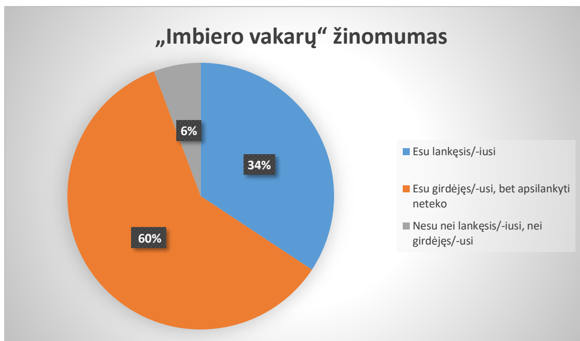
1 diagrama „Ar esate girdėjęs/lankęsis trumposios prozos skaitymuose „Imbiero vakarai“?“

Antruoju klausimu norėjome sužinoti, ar apklausoje dalyviai yra lankęsi/girdėję apie literatūrinius „Imbiero vakarus“ .